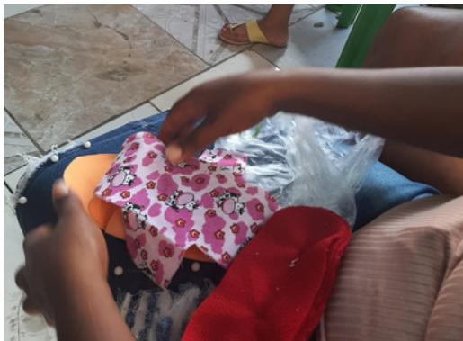
Oficinas de Absorvente Sustentável