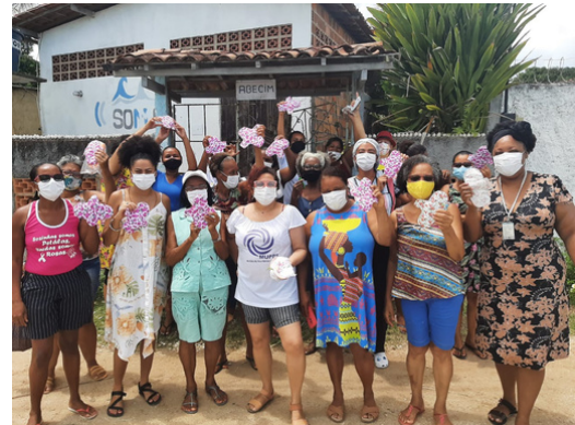
Roda de Diálogo