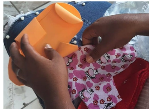
Oficinas de Absorvente Sustentável